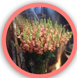
PIANTE E FIORI