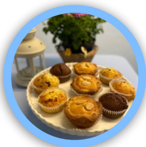
BISCOTTI E CONFETTURE

Bomboniere, Quaderni, Fiori, Biscotti, contribuisci a trasformare un regalo in una economia etica e sostenibile.