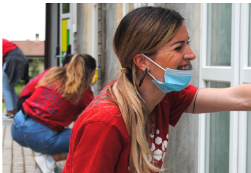
VOLONTARIATO DI IMPRESA

Dialogo, circolazione delle idee, conoscenza, creazione di legami che durano nel tempo stanno alla base dei nostri eventi di coesione sociale. Invitiamo testimoni del nostro tempo per parlare di tematiche diverse: la diversità, l'educazione, la natura, la cittadinanza responsabile.