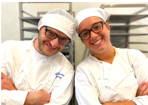
TIROCINIO FORMATIVO SERVIZIO CIVILE

Per la Noi Genitori rappresentano una risorsa insostituibile per poter offrire servizi di qualità.